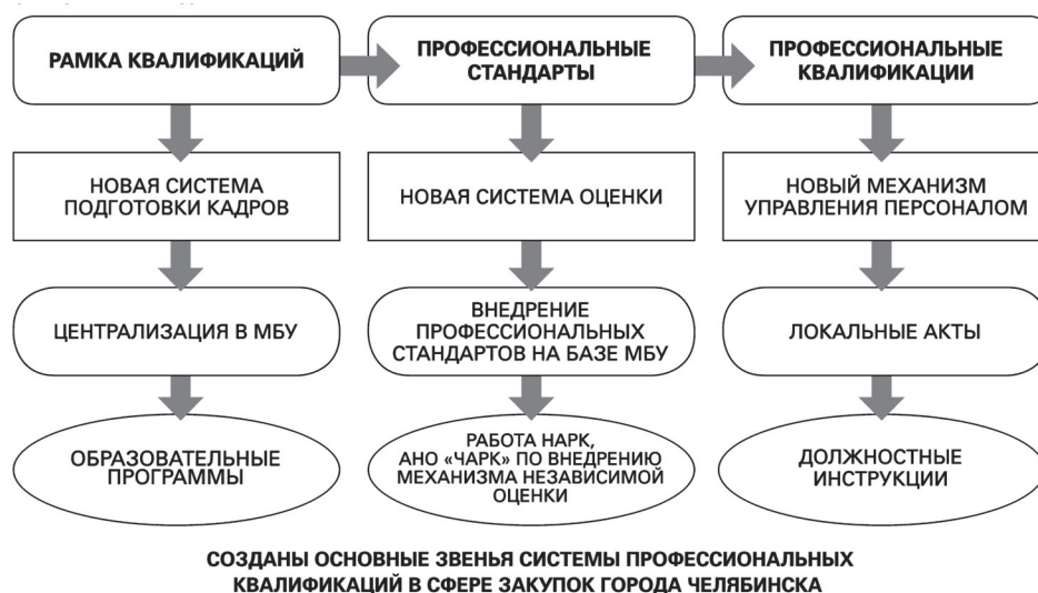
Рис. 3. Основные результаты практики

Также необходимо отметить создание и развитие системы профессиональных квалификаций , учитывающей как современные тенденции на уровне Российской Федерации, так и специфику функционирования контрактной системы в г. Челябинске. В общем виде элементы системы профессиональных квалификаций приведены на рисунке 3 .