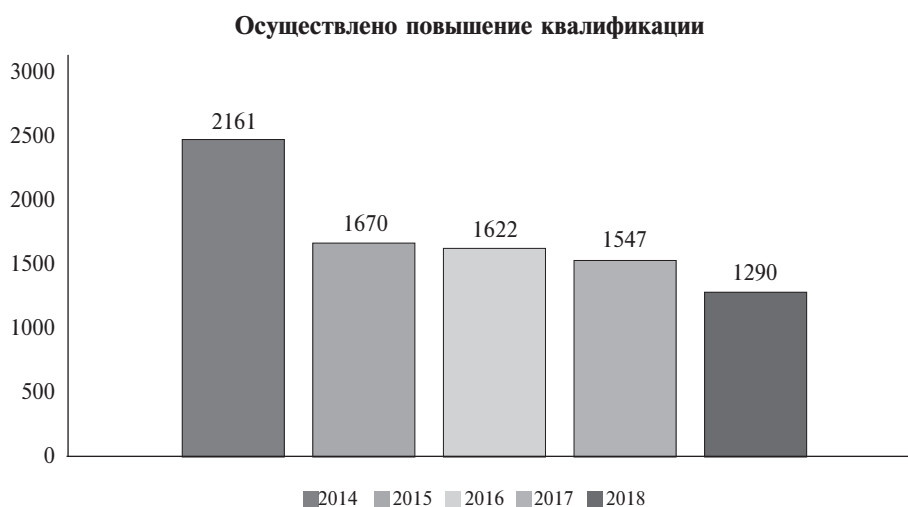
Рис. 2. Количество специалистов, прошедших программы повышения квалификации

Учебным центром на базе разработанных программ с 2014 по 2018 гг. проведено повышение квалификации более 8,5 тыс. специалистов подведомственных учреждений с учетом модели управления контрактной системой города, определенной Концепцией перехода к контрактной системе. Детальная информация о количестве обученных приведена на рисунке 2 и в таблице 2.