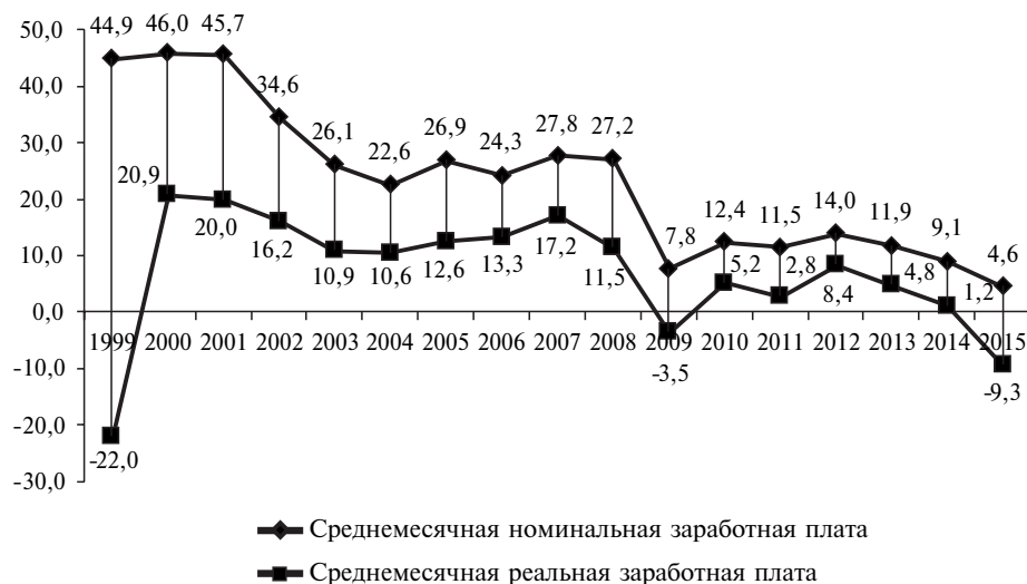
Рис. 1. Динамика среднемесячной номинальной и реальной заработной платы в РФ, в % к предыдущему году

Анализ динамики средней заработной платы за период 1999–2015 гг. позволяет выделить пять этапов в изменении номинальной и реальной заработной платы (см. рис. 1).