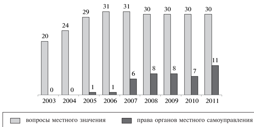
Рис. 4. Количество полномочий муниципальных районов

нятый для сравнительного анализа показателей бюджетной и налоговой обеспеченности региональных и муниципальных бюджетов по методике ОЭСР временной лаг в 10–15 лет по ряду российских показателей не информативен . Это потребовало уточнения перечня и системы сбора информации. Такая работа была проведена при составлении территориального обзора Красноярской агломерации, что позволило, как нам представляется, выйти на ряд рекомендаций общероссийского уровня.