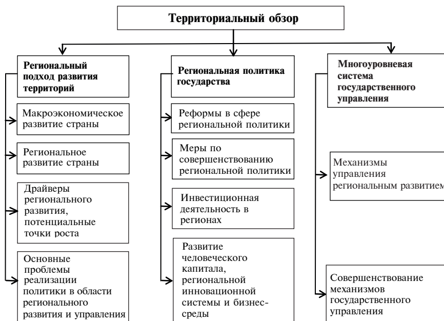
Рис. 1. Общая концепция территориального обзора

селения по регионам, сопоставление данных с другими регионами OECD ; уровень занятости и безработица в регионах, кривая Бевериджа, анализ тенденций; анализ уровня безработицы и плотности населения регионов; оценка вклада регионов в общенациональный рост и др.