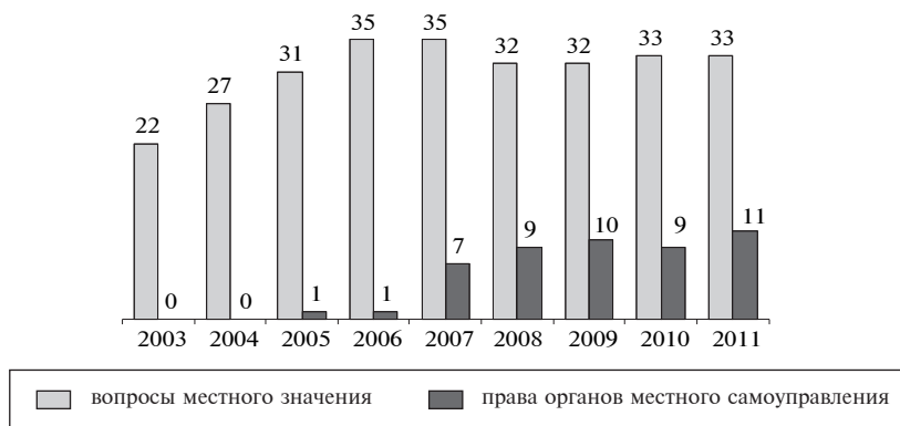
Рис. 3. Количество полномочий поселений

За время же, прошедшее после принятия Федерального закона от 6 октября 2003 г. № 131-ФЗ «Об общих принципах организации местного самоуправления в Российской Федерации», изменения в перечень вопросов местного значения вносились 58 раз. При этом перечень вопросов местного значения, установленный для муниципального образования каждого вида (поселения, муниципальные районы и городские округа), подвергался корректировке 17 раз, общий перечень полномочий, установленный в ст.17 этого Закона – 8 раз. В результате перечень вопросов местного значения поселения увеличился на 11 пунктов, района – на 10, городского округа – на 12 (см. рис. 3–5).