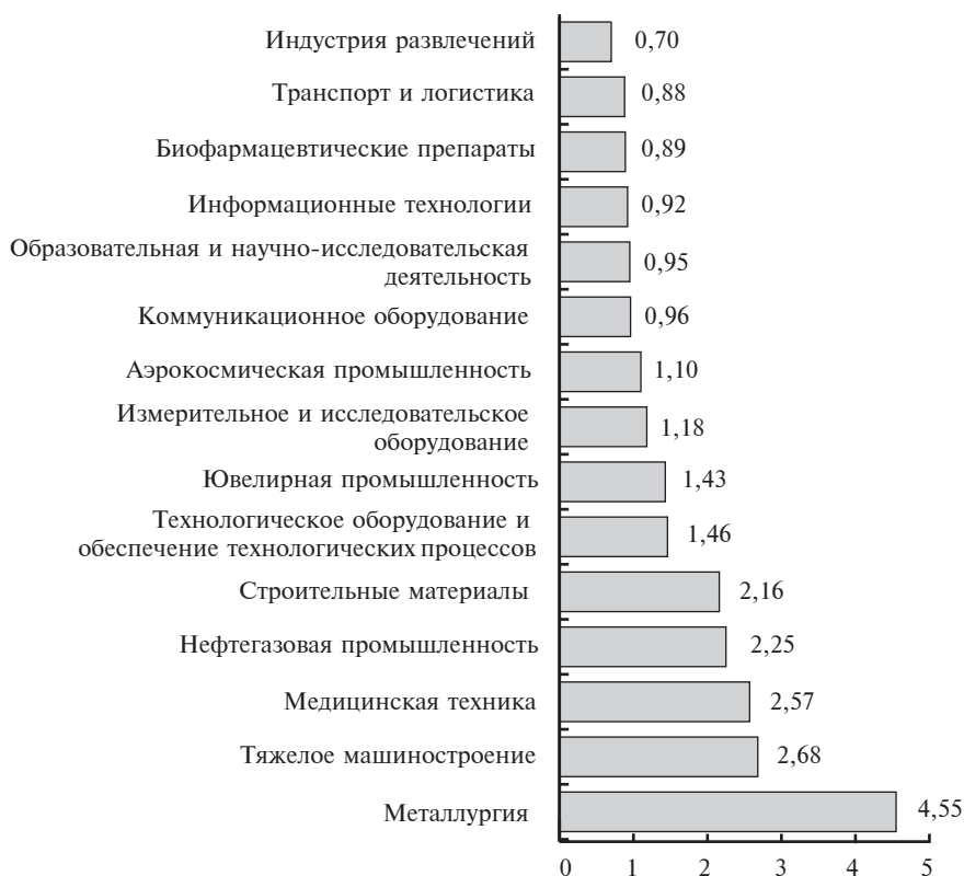
Рис. 1. Ранжирование кластерных групп Свердловской области по коэффициенту локализации

Перспективность государственной поддержки кластерного развития Среднего Урала определялась на основе соответствия кластерных инициатив прежде всего общестратегическим приоритетам развития Российской Федерации и Свердловской области, а также приоритетам научно-технологического развития. Кроме того, существенным фактором в распространении кластерной политики является степень реализации кластерной инициативы или, иначе, уровень развития конкретного кластера.